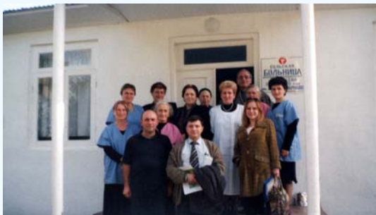
“ემპათია” და პარტნიორი ორგანიზაციის – გალის კრიზისული ცენტრის შტატი გალში ვიზიტისას.

ძირითად მიზნობრივ ჯგუფებში შედიან წამების მსხვერპლები, განს. საპატიმროებში და წინასწარი პატიმრობის საკნებში მყოფი პირები, წამების მსხვერპლი - ყოფილი პატიმრები, წამების მსხვერპლი – IDP-ები, ჩეჩენი ლტოლვილები და მათი ოჯახის წევრები. აქციის ხანგრძლივობაა 12 თვე.