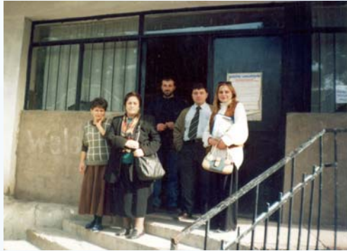
‘ემპათიის’ ვიზიტი გორის ახალგაზრდულ სახლში.

შემთხვევის მმართველი (4) : სასამართლო ექსპერტ- ფსიქიატრი; ფსიქიატრი (2), თერაპევტი;